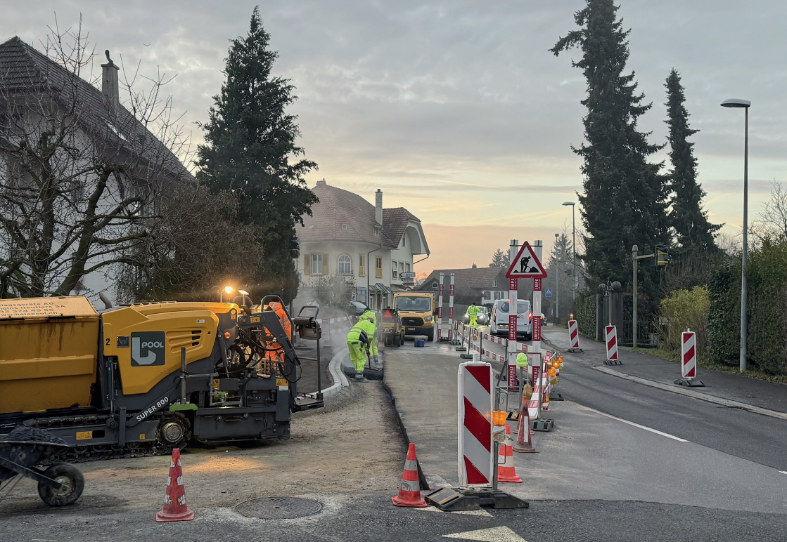
Belagseinbau an der Hauptstrasse in Bellmund im Dezember 2025.