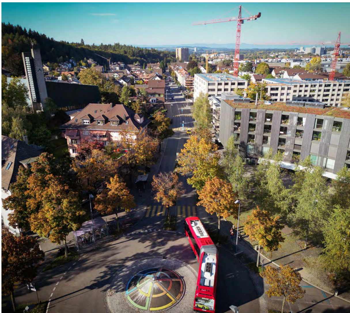
Die Könizstrasse hat auf dem Abschnitt zwischen der Waldeggstrasse und dem Neuhausplatz ihr Lebensende erreicht. Sie wird vom 20. Februar bis Herbst 2023 umfassend saniert.